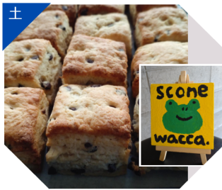
scone wacca. 焼菓子(スコーン)