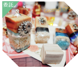
Coconut Orange ウッドレジンアクセサリー