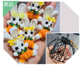
七彩堂の白兔 ちりめんしろ兔