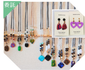
Luna Apricus アクセサリー