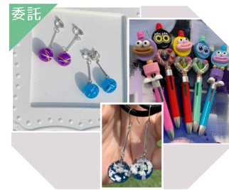
felice カスタムボールペン、アクセサリー