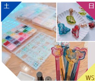
popori シャカシャカ雑貨WS、レジン雑貨