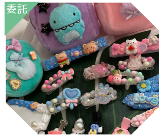
えまーべる ホイッステコ 布小物