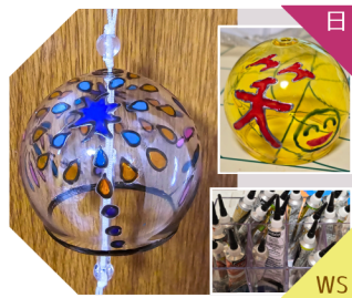
ポージュラカ WS、ミニ風鈴作り(ガラス)