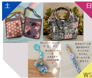
Moon Bow 布製品 キーホルダーWS