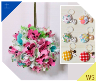
手づくり屋さんmiya フラワーボールWS、布小物