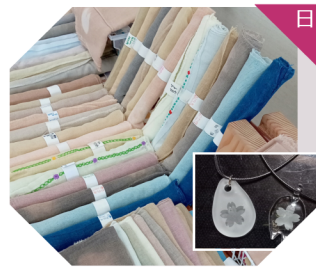
polyfony 草木染め作品、アクセサリー