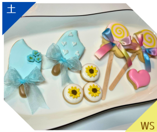
メルヴェイコ アイシングクッキーWS